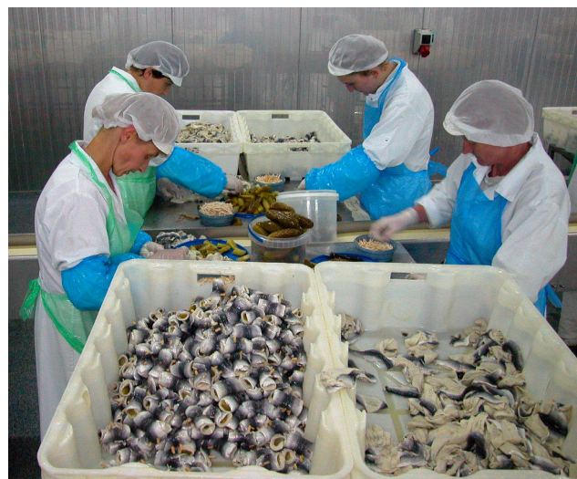
Figur 1: Foredling av sild i Polen

Prosjektet ble satt i gang som følge av betydelige utfordringer for foredlingsindustrien i Norge og et behov for å tenke nytt. Tyskland og Polen er viktige markeder for norsk sild og det er særlig edikkmarinerte og saltede sildeprodukter som etterspørres her. Ustabile priser de siste årene, har gjort at det har vært behov for å tenke nytt i forhold til disse viktige markedene.